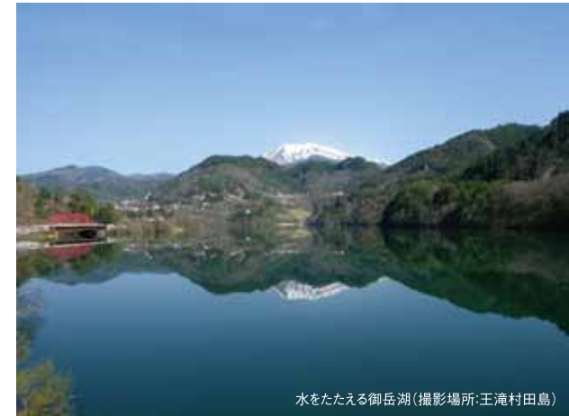
水をたたえる御岳湖(撮影場所:王滝村田島)